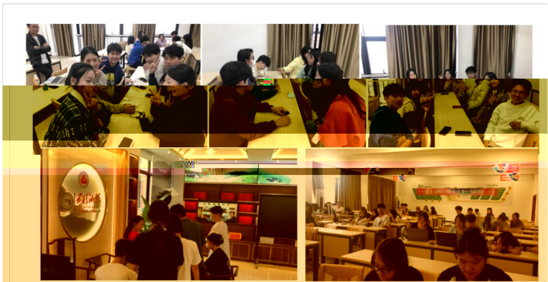
中国实训项目现场